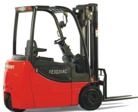
电动平衡重乘驾式叉车

上述产品均是以蓄电池或人力为动力的搬运、仓储和装卸类车辆，是物流行业的重要装备，在国民经济各行业的物料装卸、搬运、仓储等环节广泛应用。