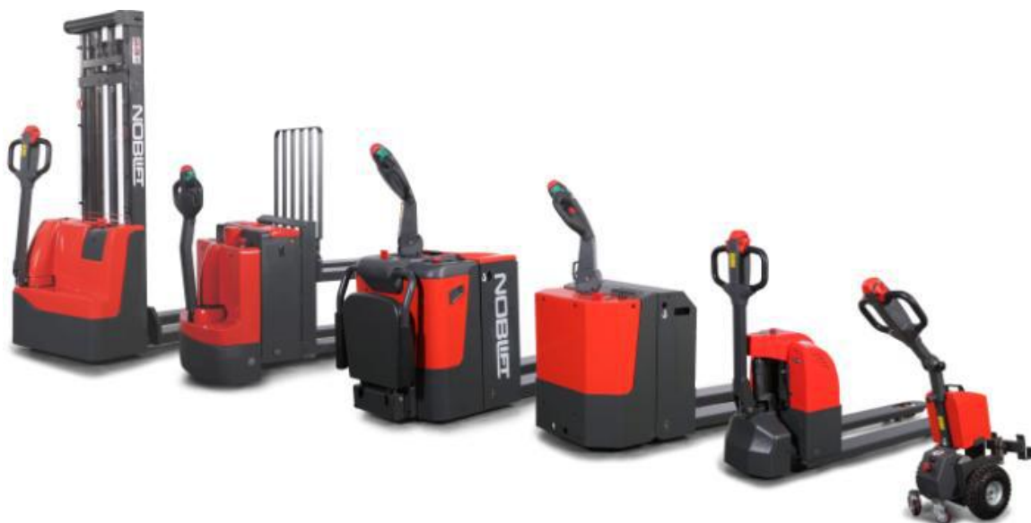
电动乘驾式仓储叉车